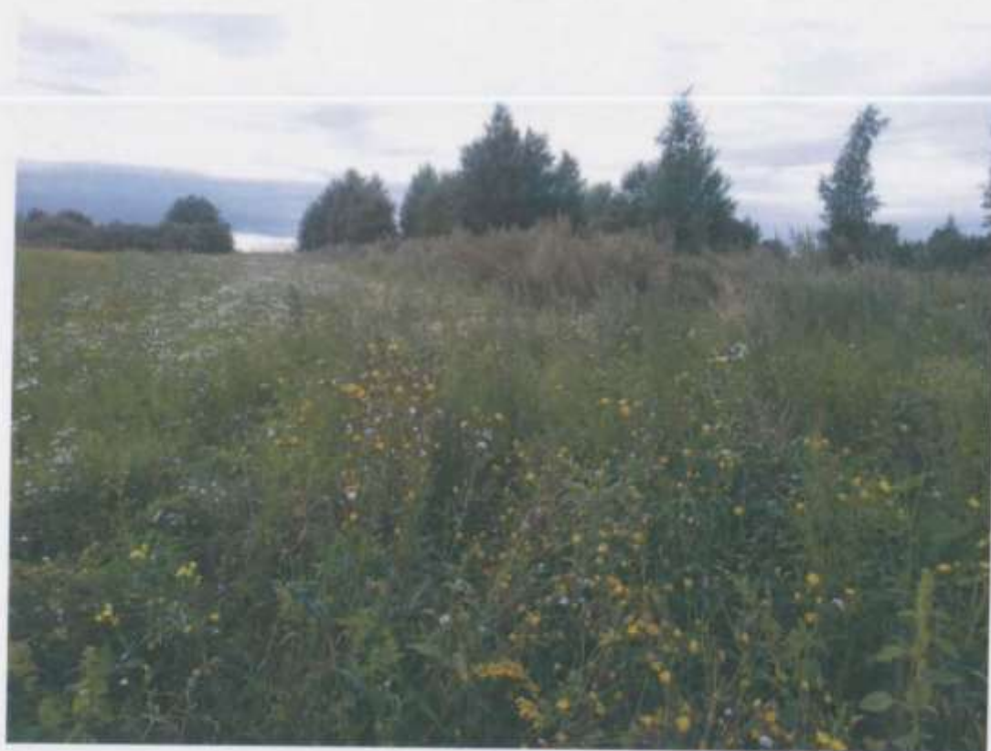
ФОТО № 1

Подпись лица, составившего фототаблицу: Боровкова Н.С.