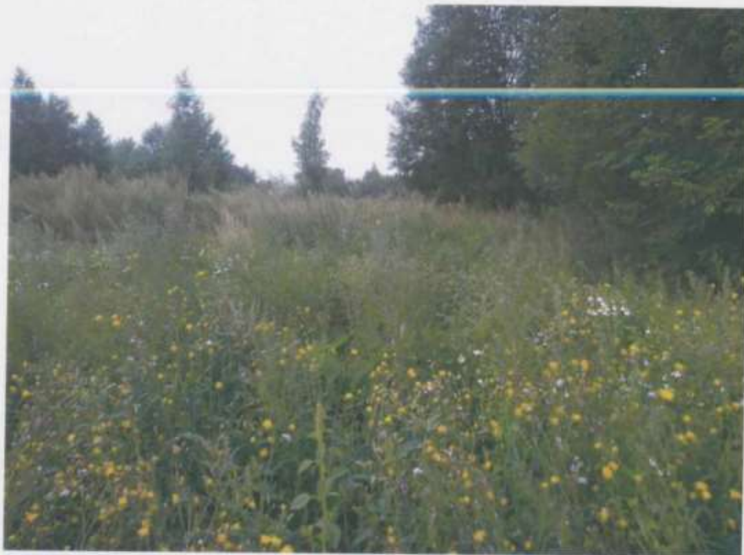
ФОТО № 2

Подпись лица, составившего фототаблицу: Боровкова Н.С.